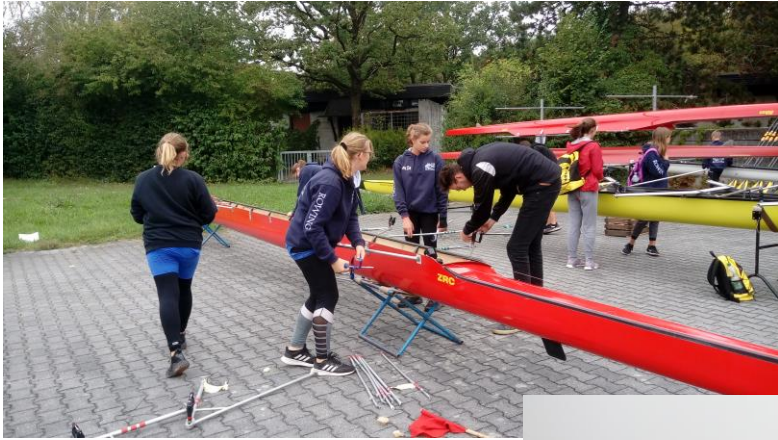
anbauen der Boote und sich warm machen